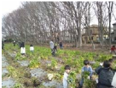
近くの畑で見かけた園児の大根収穫風景

年末から年明けにかけ35日間、雨降らずの1月は葉っぱ物の生育弱く黄色が目立ったが、ようやく20日からの雨で一息ついた様子です。次の寒波が来るまで大きくなーれ。来月から農園横の小川改修工事が始まり年度末に終わるとの事。道幅の広がり期待できます。1月に近所の乗馬倶楽部から馬糞（ポロと言います）もらって、今年の元肥入れをしっかりと2月までやりましょう。