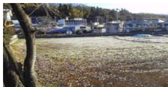
— 農園開設申請地 —

市民農園の新規開設に向けて 活動中です。 ① 市民への農業体験の場を提供 ② 農地の活用 ③ 地域の活性化・環境景観対応 を目標に現在新規開設に向け 事務局が中心になって行政と折衝を 進めています。