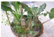
— 春の七草籠 —