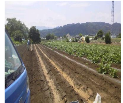
里芋の施肥・土寄せ作業