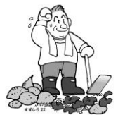
ジャガイモ生育中