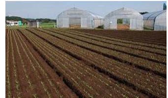
小比企町で見かけた風景 秋のつり芽