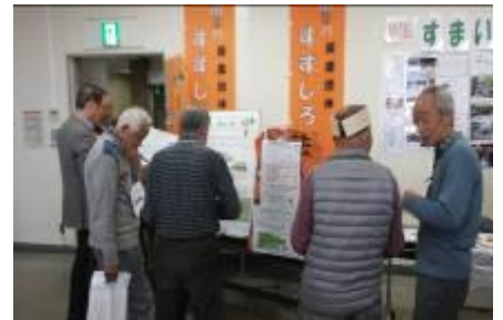
3/10 「お父さんお帰りなさいパーティ」 会の PR と会員募集

年間 援農目標時間 18000h 4 箇所 ・ 70 区画 料理教室 + 各種イベント