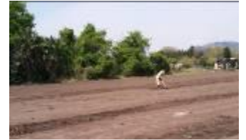
広い畑での 草かき作業